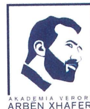
Akademia Verore "Arbër Xhaferi"